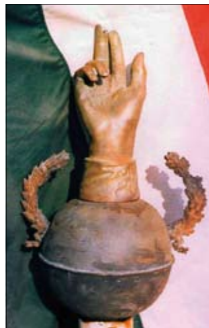
A nagyjából egy kilogrammnyi réz biztosan nem ment meg senkit sem az éhhaláltól