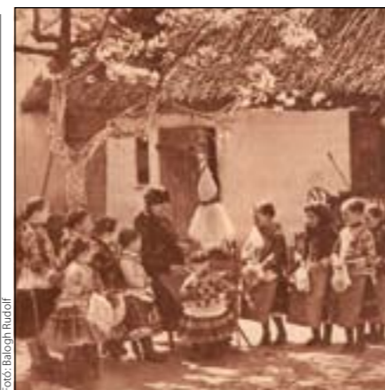
Fonólecke a falusi „dedóban”

Településünkön – az országos gyakorlat-hoz hasonlóan – a kenderföld vetésterülete egy tagban került kijelölésre. Mindenki igényelhetette, de legfőképpen a zsellérek bérelték. A kétszer-háromszor felszántott földbe a férfiak vetették el a magot. Ehhez pl. ilyen babonás hiedelmek kötődtek: a vetőlepel vagy zsák fehér legyen; Szent György hetében történjen teliholdkor; a vetés befejeztével magasra kell ugrani. Farsangkor a lányok is nagyokat ugrottak tánc közben, hogy a kender magasra nőjön. A termés 14 hétre érett be, a virágos hímszálak nagyobbak voltak, s ez