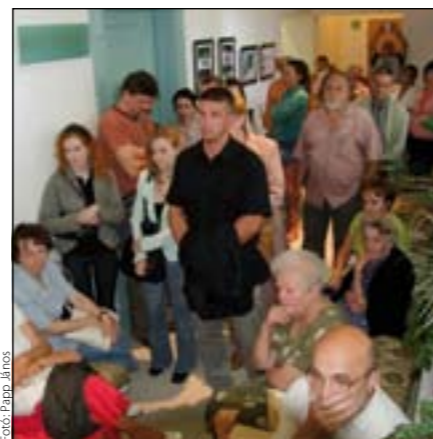
Ismét sok érdeklődő zsúfolódott össze a Közös Nevezőnek otthont adó folyosógalériában