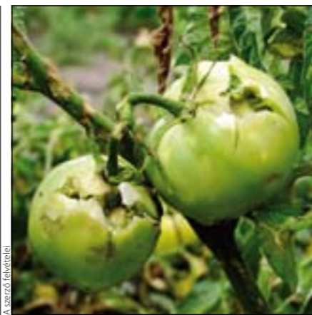
Idén nem lesz paradicsomszüret Monor határában. A bogycok ugyanis úgy néznek ki, mintha puskagolyó ment volna keresztül rajtuk

„Csupán két kilométeren múlt, hogy a vihar ne a városban végezze mérhetetlen pusztítását.”