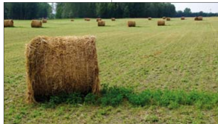
A kép első látásra megtévesztő. A bála mellett ugyanis nem annak árnyéka látszik, hiszen borús volt az idő, hanem a „jégárnyékban” épen maradt lucerna. A többi a vihar aratta le...