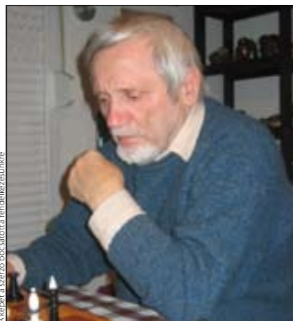
A kép a szerző Bors-sáton a rendezvényünkre

Utóbbi évek kiállításai: Veszprém, Wunsiedel 1996, Szigliget, Vár Galéria 1997, Keszthely, Kastély Múzeum 1999, Alsópáhok, Kolping Hotel 2002, Szigliget, Vár Galéria 2003, Balatonalmádi 2004, Keszthely, Balaton Fesztivál és Monostorapáti, Művésze-