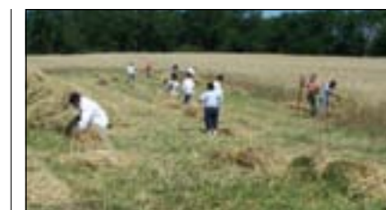
Munkában az aratók