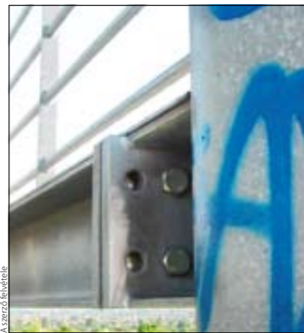
A Kilátót építető szakember szerint akár 1-2 darab csavar hiánya is életveszélyt jelenthet!

Orbán szobrot is többször megrongálták. (Köszönet az újra és újra helyreállítóknak!) Jelenleg is hiányzik a kezéből a fakereszt... Lehet, hogy ezért sem tud teljes egészében „hivatása” magaslátán állni?